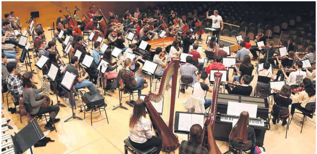
Un instant de l'assaig de dimecres al migdia, a l'Auditori, per preparar el concert d'aquest vespre

El creixement del nivell dels alumnes és tan exponencial com ho és la ductilitat de la JONC per aconseguir nous reptes. La primera promoció es va triar entre 112 músics. Des de fa anys, les audicions reben unes 700 persones (per seleccionar-ne un