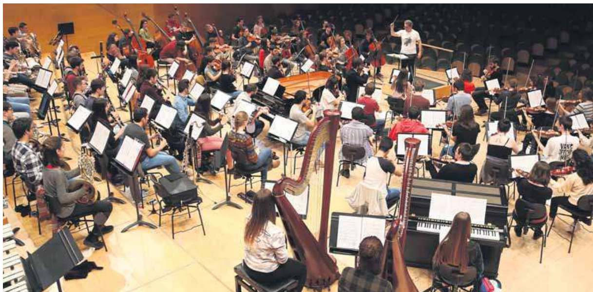
Un instant de l'assaig de dimecres al migdia, a l'Auditori, per preparar el concert d'aquest vespre

El creixement del nivell dels alumnes és tan exponencial com ho és la ductilitat de la JONC per aconseguir nous reptes. La primera promoció es va triar entre 112 músics. Des de fa anys, les audicions reben unes 700 persones (per seleccionar-ne un